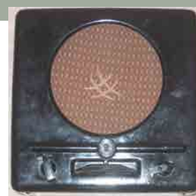
Radio, type Volksempfänger, Duitsland, 1933

De propaganda beheerst het volledige culturele leven en de media. Het is vooral via de radio dat ze binnendringt bij alle gezinnen en dat ze de massa controleert, beïnvloedt en hersenspoelt. Met trefwoorden, die eerder het gevoel dan het verstand bespelen, wordt een wereld in zwart-wit getekend, waar alle problemen simpele en evidente oplossingen hebben. Ze moedigt een personencultus aan rond de figuur van de Leider door zorgvuldig voorbereide massamanifestaties: choreografie, muziek, zang, uniformen, vlaggen en symbolen scheppen een gevoel van samenhang binnen eenzelfde gemeenschap.