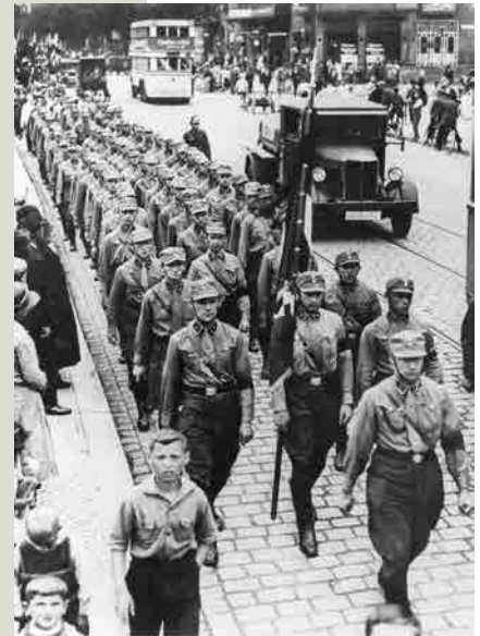
Optocht van leden van de SA Berlin, 1922, © BPK, Berlin

Duitsland komt heel verzwakt uit de Grote Oorlog. Het Verdrag van Versailles legt het land buitengewoon zware herstelbetalingen op en een ongekennde economische crisis woedt op hetzelfde ogenblik. Het verdrag wordt ervaren als een Diktat en