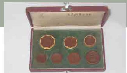
Lemen geldstukken, Saksen, 1923

Na de oorlog kent Duitsland een catastrofale inflatie die de ineenstorting van de mark met zich meebrengt. De bijkomende tabel geeft een idee van de evolutie.