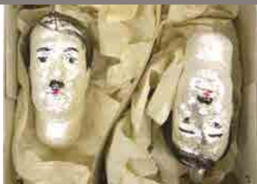
Nazistische kerstversiering of zogenaamde Julschmuck, Duitsland, ca. 1943

Deze kerstversiering bestaat onder meer uit twee kerstballen met beeltenis van Adolf Hitler. Vanaf 1933 voeren de nazi's een verregaande Gleichschaltung of nazificatie van de Duitse samenleving door. Zelfs Kerstmis moet er bij de meest overtuigde nazi's aan geloven en maakt plaats voor een mix van Germaanse en christelijke elementen. De meest populaire christelijke feestdag, rond de geboorte van de Joodse figuur Jezus, strookt namelijk niet met de racistische