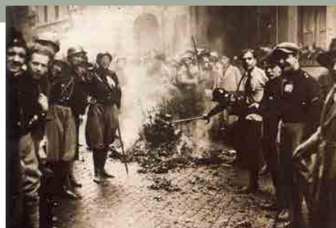
Zwarthemden verbranden een hoop “Paese” kranten, s.d., © L’Illustration/Van Parys Media

In de drie dictaturen wordt de bevolking aan terreur onderworpen: afschaffing van elke individuele vrijheid, gevangenschap of eliminatie van politieke tegenstrevers en “asocialen” (homoseksuelen, gehandicapten, zigeuners, enz.), strikte politiecontrole over de bevolking, creatie van een staatspolitie, creatie van kampen (concentratie- en uitroeiingskampen in Duitsland, goelag in de USSR, verbanning op onherbergzame eilanden in Italië). De kustenaars moeten zich onderwerpen en de propaganda dienen om vervolging of dood te vermijden. Velen vluchten naar het buitenland. Nationaliteit (in de USSR) en ras (in Duitsland) zijn voldoende criteria om gedeporteerd of vermoord te worden.