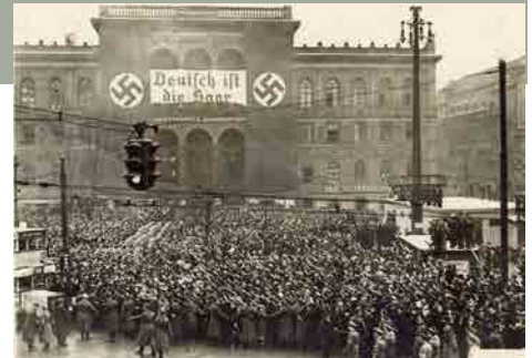
Volksraadpleging over de teruggave van de Saar aan Duitsland, januari 1935