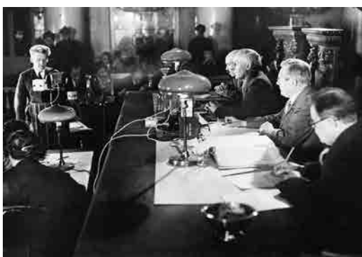
Proces van 8 ingenieurs die verdacht werden van verraad, Moskou, december 1930

In 1922 wordt onder de vleugels van het Russische bolsjewistische regime de Unie der Socialistische Sovjetrepublieken (USSR) opgericht. Ze staat de afschaffing van het privébezit en een strikte planning van de economie voor. Het stelsel wil een “nieuwe mens” voortbrengen, een mens die door zijn werk de natuur kan bedwingen. De kapitalistische economie, belichaamd door koelaks (landbouwers-eigenaars), wordt vervangen door een gedwongen collectivisering van productiemiddelen en de industrie wordt aan strenge productiequota onderworpen.