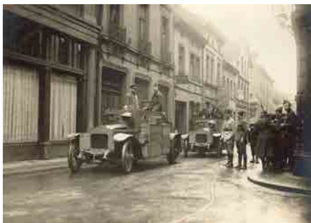
Belgische pantserauto's, Duisburg, Duitsland, 1922-1923

Het Verdrag van Versailles voorziet dat het Duitse leger de volledige linkeroever en een 50 kilometer brede strook op de rechteroever van de Rijn ontruimt. Belgische troepen bezetten dit gebied samen met de Fransen, de Britten en de Amerikanen