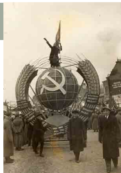
Symbol van de wereldrevolutie

Van bij het begin van de revolutie in 1917 nemen talrijke officieren van het voormalige tsaristische leger de wapens op tegen het bolsjewisme. De strijd tussen de “Roden” (bolsjewieken) en de “Witten” (aanhangers van Groot-Rusland en anticommunisten) is onbeschrijfelijk wreed en deze burgeroorlog zal in Rusland meer slachtoffers maken dan de Eerste Wereldoorlog. De “Witten” worden verslagen, ondanks de -soms symbolische- steun vanuit het Westen en Japan. Duizenden gaan in ballingschap. Het nieuwe bolsjewistische bewind ontaardt al snel in een dictatuur waarbij de oorspronkelijke leer vaak opzij wordt gezet onder het mom van het “oorlogscommunisme”. In 1922 wordt de Unie van Socialistische Sovjetrepublieken opgericht, een -in theorie- vrijwillige vereniging van verschillende gebieden van het oude tsaristische rijk. Lenin sterft in 1924 en hij heeft geen opvolger aangeduid. Een machtsstrijd stelt de partijkaders als tegenstanders tegenover elkaar. Stalin haalt uiteindelijk de bovenhand door zijn potentiële rivalen uit te schakelen.