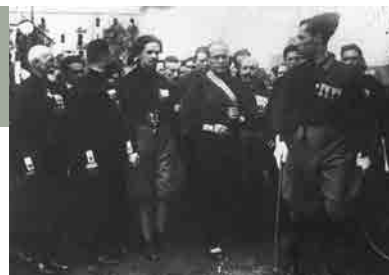
Vorbereiding van de Mars op Rome, Napels 22/10/1922

In 1919 sticht Mussolini de eerste fasci di combattimento (gevechtseenheden of fascistische milities). De strijd wordt vooral aangegaan tegen socialisten en communisten. De financiële steun van industriëlen en grootgrondbezitters wordt snel verkregen. Eind 1919 telt de beweging 17.000 leden, die voor het grootste deel gerekruteerd worden onder