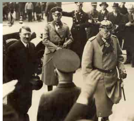
Hindenburg en Hitler, Berlin, 1934