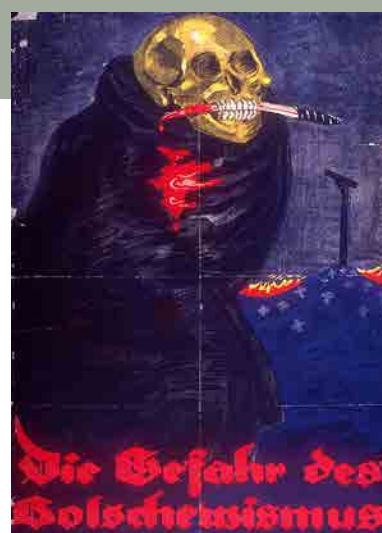
Rudi Feld, De gevaren van het bolsjewisme , facsimile, Duitsland, 1919

Deze bedenkingen kunnen gemaakt worden op basis van objecten die de Vrijkorpsen illustreren (vlag van de Stahlhelm, medailles, kentekens en vooral de affiche “Die Gefahr des Bolchevismus”).