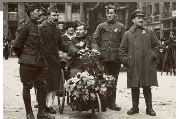
Oudstrijders, Brussel, 1919

“Aan het werk dus, Mijne Heeren! Dat God u helpe om van België een steeds eensgezind Vaderland te maken, meer en meer waardig om door zijne kinderen bemind te worden.” Op 22 november 1918, bij zijn terugkomst in