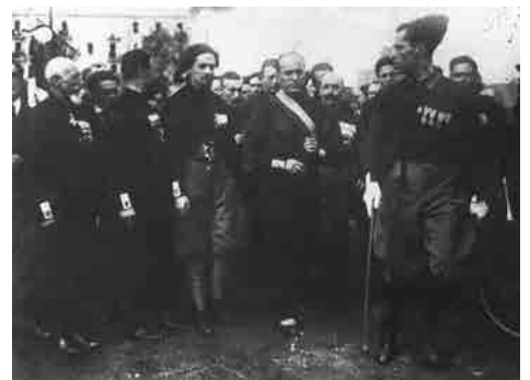
Vorbereiding van de mars op Rome, Napel, 22/10/1922

Na heel wat touwtrekkerij en aarzelingen kiest Italië in mei 1915 de zijde van de geallieerden in de Eerste Wereldoorlog. De oorlog wordt een echte catastrofe voor de Italianen: meer dan 600.000 soldaten verliezen het leven, de werkloosheid stijgt en de munt wordt gedevalueerd. Het land zit psychisch en fysiek volledig aan de grond, de middenklasse is danig verzwakt. Daarenboven, in tegenstelling tot de vooroorlogse geallieerde beloften, maakt Italië slechts een heel beperkte territoriale winst. Deze frustrerende situatie veroorzaakt een radicale politieke evolutie. Stakingen, sociale betogingen evenals een poging tot annexatie van Fiume door oud-strijders ( Arditi ) worden door de regering heftig onderdrukt. In dit opstandige klimaat wordt de fascistische partij, een extreem-rechtse nationalistische partij, opgericht in 1919. Ze ontwikkelt een antidemocratische ideologie gebaseerd op de afwijzing van het socialisme, van de klassenstrijd, enz. Benito Mussolini staat aan het hoofd van deze partij en neemt de macht in 1922. Hij dreigt geweld te gebruiken (de “Mars op Rome”) en dwingt zo koning Victor-Emmanuel hem aan het hoofd van de regering te stellen. Hij trekt alle