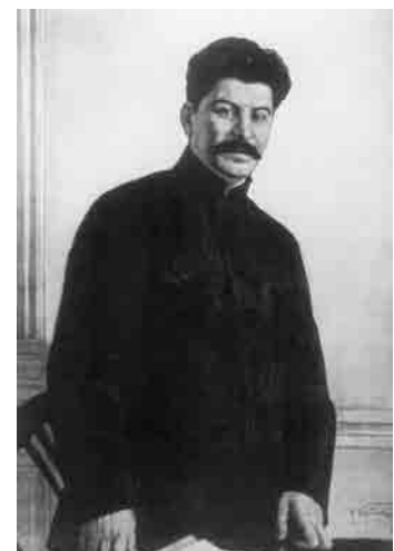
Portret van Stalin, s.d.

De oorsprong van het communisme, en meer algemeen van het socialisme, gaat terug tot de 19de eeuw. De ideeën van de Verlichting en de eerste sociale conflicten die voortvloeien uit de industriële revolutie oefenen een belangrijke invloed uit op heel wat intellectuelen. Deze laatsten worden zich bewust van het belang van de arbeidersklasse en in hun ogen moet een onafhankelijke proletarische beweging het liberale kapitalisme vervangen. Eén van deze vroege theoretici, Karl Marx, zal een origineel ideeëngoed ontwikkelen: het communisme. Tijdens de vergaderingen van de Eerste Internationale, die werd opgericht in 1864, zal Marx geleidelijk zijn ideeën opdringen aan de vertegenwoordigers van de arbeidersklasse. Hij verwerpt de kapitalistische maatschappij en wenst een collectivisering van alle productiemiddelen te