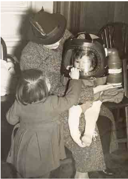
Gasmasker voor baby, GB, c.1938

Van 1936 tot 1939 tekenen de gevaren zich in Europa duidelijker af. Net zoals andere democratieën is ook België overgeleverd aan rechtse groeperingen die autoritair zijn en tegen het parlement zijn gericht. De Duitse vijand wordt steeds dreigender. België organiseert zijn verdediging en bereidt zijn bevolking voor. Het land opteert voor neutraliteit in de hoop aan een nieuw conflict te ontsnappen.