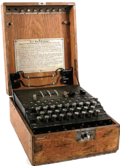
Codeertoestel Enigma met drie tandwielen, Duitsland, 1935-1939