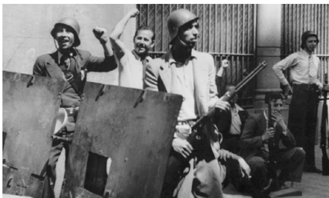
Republikeinse soldaten, Madrid, 1936-1939

De Spaanse verkiezingen van 1936 leveren een volksfrontregering op, gevormd door een grote coalitie van linkse en extreemlinkse partijen ( Frente popular ). Die overwinning wordt niet aanvaard door de grootgrondbezitters, die daarin gesteund worden door een deel van het leger, extreemrechts en de Spaanse katholieke kerk. Samen beramen ze een staatsgreep die leidt tot een lange burgeroorlog (juli 1936-februari 1939). Nationalisten