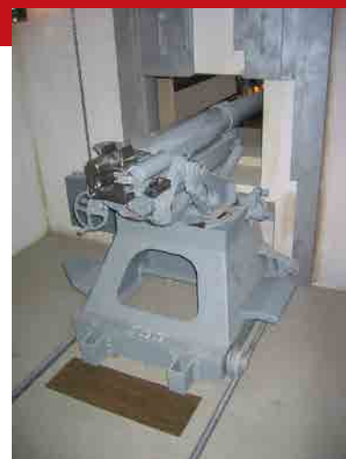
Kazemat van de Vesder

De Belgische bevolking bekijkt de verschillende opties vanuit geografisch oogpunt: in de Ardennen wordt de grensverdediging verkozen, in het centrum van het land wordt meer voor een verdediging in de diepte gevoeld. Op politiek vlak geraakt het debat op termijn niet meer op de agenda, maar bij de generale staf leeft het probleem intensief voort. Uiteindelijk wordt een typisch Belgisch compromis gevonden. Talrijke militaire bouwwerven worden langs de grenzen opgestart en vanaf 1936 wordt ook aan een verdediging in de diepte gewerkt.