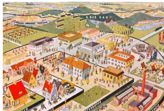
Territoriale organisatie van de Duitse samenleving, Signal, Duitsland, circa 1940

Met Hitlers machtsovername komt de herbewapening en militarisering van Duitsland in een stroomversnelling terecht. Het leger wordt aan de nationaalsocialistische partij onderworpen. Het regime steunt tot 1934 ook op een paramilitaire militia, de SA ( Sturmabteilung = stormtroepen) die “orde” doet heersen in de Duitse straten, evenals op de SS ( Schutzstaffel = beschermingseskadron). De SS verzekert aanvankelijk de persoonlijke veiligheid van de Führeren wordt nadien één van de belangrijkste