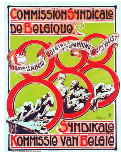
Affiche van Ch. Van Roose, fac-simile, s.d.

Gesteund door een regering van nationale eenheid introduceert de koning in zijn troonrede een nieuwe sociale wetgeving. Omdat alle Belgen evenveel hebben geleden, moeten ze ook allemaal dezelfde rechten en voordelen genieten. Deze sociale hervormingen zijn in de eerste plaats bedoeld om de opkomst van het communisme te stuiten. Zo wordt een reeks nieuwe wetten gestemd die paritaire comités van werkgevers en werknemers (1919), het wettelijk pensioen op 65 jaar (1920), de 8-uren werkdag (1921), de vrijheid van vereniging op alle gebieden (1921) en de verplichte ouderdomsverzekering (1924) introduceren. Daarnaast worden er nieuwe wetten gestemd over de oorlogsschade, de pensioenen van de oorlogsinvaliden, -weduwen en -wezen.