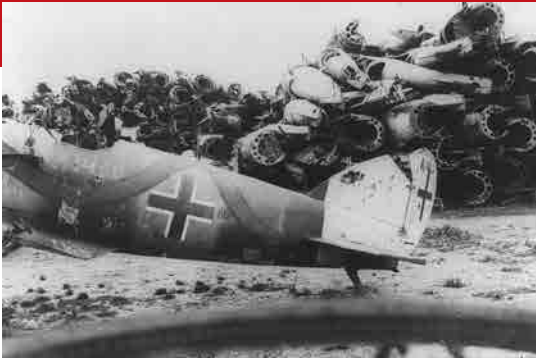
Gedwongen vernietiging van Duitse oorlogsvliegtuigen, 1919, © IWM, London