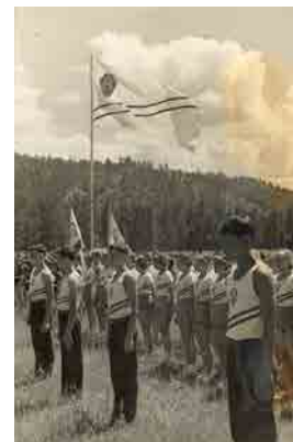
Jeugd Sovjet-Unie

De legerdienst wordt op achttien maanden gebracht en er wordt sterk geïnvesteerd in de uitbouw van een toekomstig modern leger. Het Italiaans landschap, vol bergen en grote vlaktes, zorgt ervoor dat de klemtoon hierbij op lichte eenheden en makkelijk vervoerbaar materiaal komt te liggen. Omdat het land weinig geïndustrialiseerd is, beschikt het koninklijke leger over weinig mechanische middelen, dit in tegenstelling tot andere Europese legers.