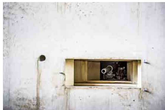
Kazemat van de Vesder