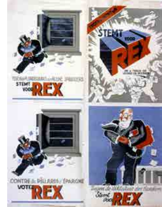
Tegen de plunders van de spaargelden, stem Rex, Uitg. Rex, België, 1936

Omdat de dreiging concreet wordt, besluit het Belgische leger zich voor te bereiden op een oorlog door in 1938 een eerste mobilisatiefase af te kondigen. De burgerbevolking ontvangt instructies over brandbestrijding bij bombardementen en gasmaskers om zich te beschermen tegen de gasaanvallen, een schrikbeeld dat na de Eerste Wereldoorlog in het collectieve geheugen was blijven hangen.