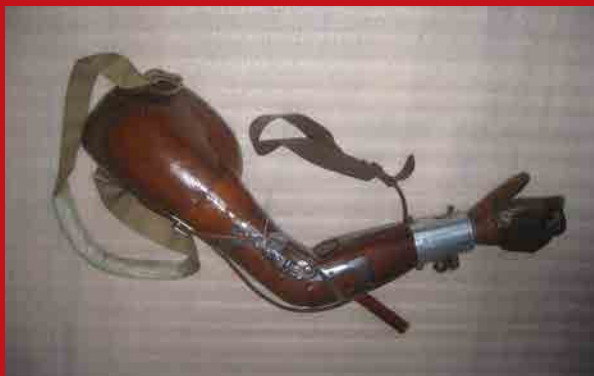
Lederen kunstarm voor een oud-strijder, uitgerust met beweegbare metalen scharnieren, Ierland, 1920