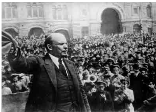
Lenin zweept de massa toe, Moskou, c.1920

De ondergang van het Russische keizerrijk wordt versneld door de Eerste Wereldoorlog. In februari 1917 ziet een burgerlijke protestbeweging het licht binnen de Doema (semi-democratisch parlement opgericht in 1905). De oppositie wint veld bij de bevolking: stakingen en gewelddadige betogingen breken uit. Het leger schaart zich achter de opstandelingen: begin maart moet de tsaar aftreden en de monarchie wordt snel afgeschaft. Kerenski (een gematigde socialist) zet een voorlopige coalitieregering op, die zowel door links als door rechts wordt betwist; onder andere omwille van haar wens de oorlog verder te zetten aan de zijde van de geallieerden. In oktober 1917 maken de bolsjewieken (radicale socialisten) gebruik van de spanningen die opduiken na de gemiste putsch van de tsaristische generaal Kornilov, van de woede van de massa en van het verval van alle instellingen om, onder leiding van Lenin, een staatsgreep te plegen met als ordewoord “alle macht aan de Sovjets”. Lenin stelt een einde aan de oorlog tegen Duitsland door op 3 maart 1918 in Brest-Litovsk een afzonderlijke vrede te tekenen ten koste van enorme territoriale en economische verliezen. Hij legt een hard en repressief autocratisch regime op dat het land in